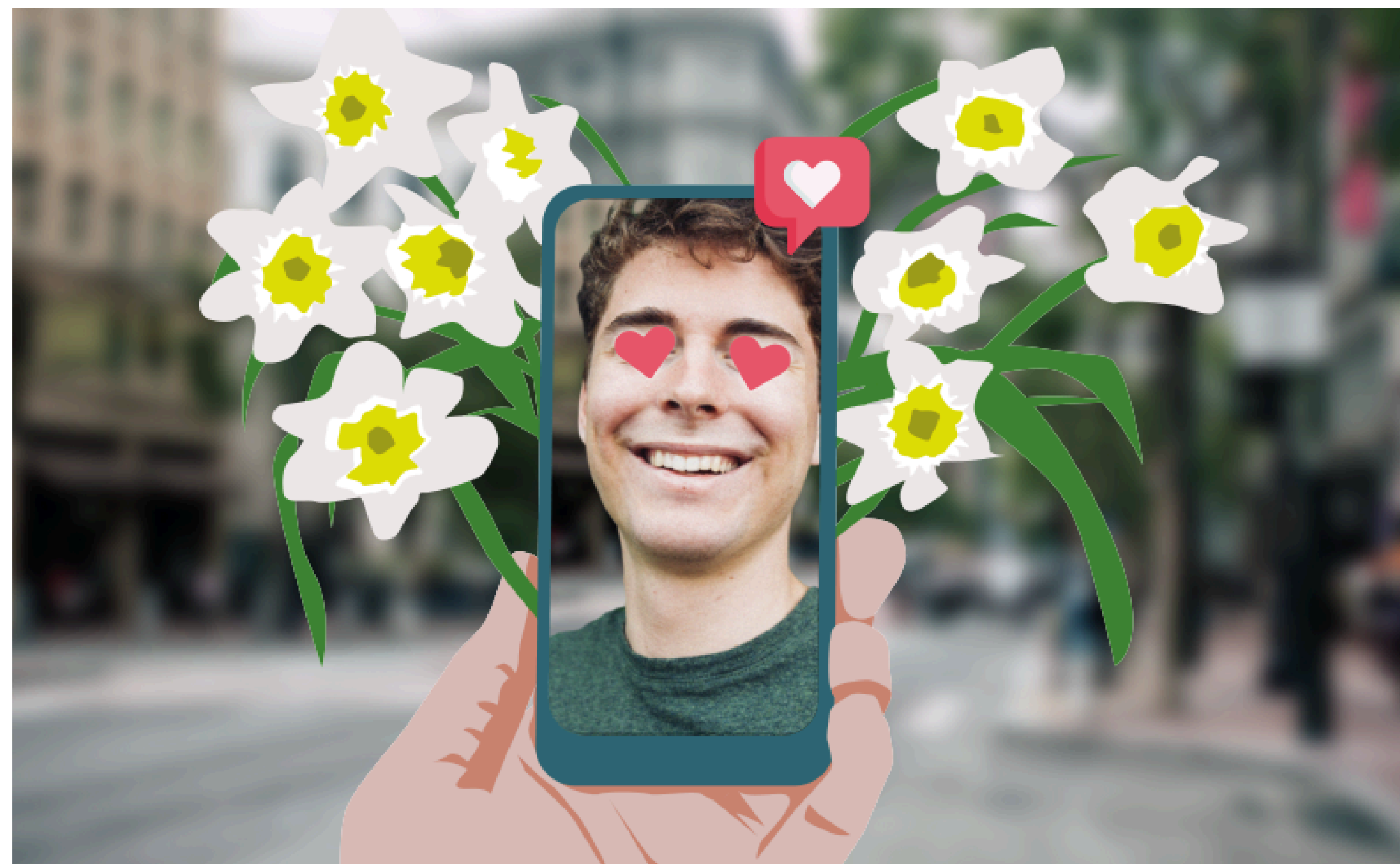
ILLUSTRATIE MIEKE VAN ZUIJLEN